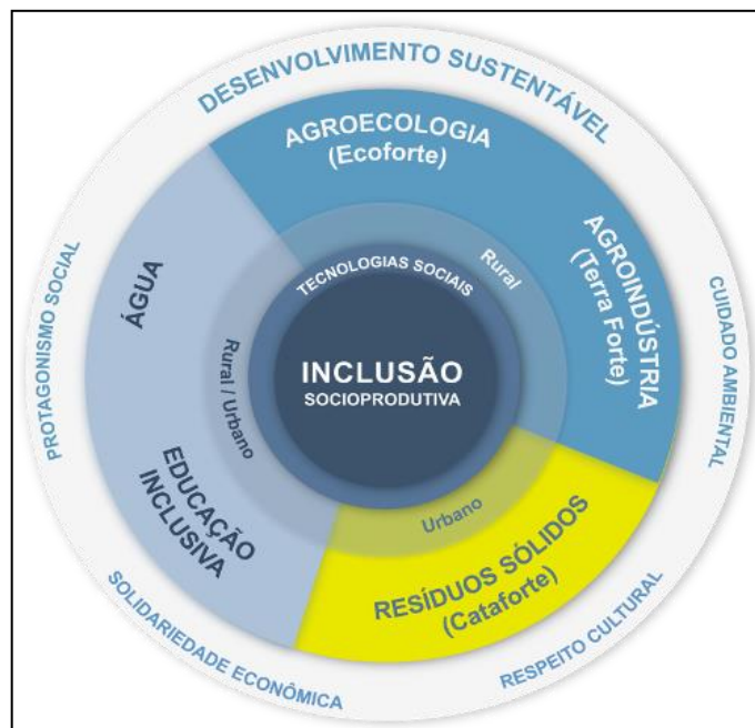
Figura 1: Estratégia de Reaplicação de Tecnologia Social.

A reprodução da TS está presente todos os setores econômicos, entretanto, sua maior proeminência acontece no Terceiro Setor, como é o caso da Fundação Banco do Brasil (FBB) que anualmente realiza uma premiação para as TS elaboradas no território brasileiro. Para a FBB o termo tecnologia é compreendido “manifestação do conhecimento”, que pode ser resumido em um processo, método, técnica, produto ou mesmo um artefato, desenvolvido na universidade, no Estado ou ainda pelo “saber popular”. A inclusão da dimensão social atribui o sentido de serem tecnologias pautadas em solucionar questões como, por exemplo, o acesso precário a água tratada, alimentação, educação, saúde ou renda. Através destas concepções a FBB elaborou suas estratégia para a reaplicação da TS (Figura 01).